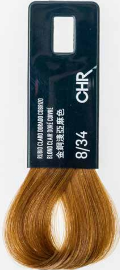
8/34 БЛОНДИН ЗОЛОТИСТО-МЕДНЫЙ