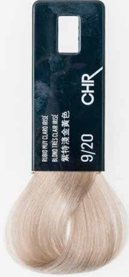
9/20 СВЕТЛЫЙ БЛОНДИН ФИОЛЕТОВЫЙ