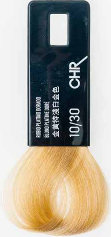
10/30 ОЧЕНЬ СВЕТЛЫЙ БЛОНДИН ЗОЛОТИСТЫЙ