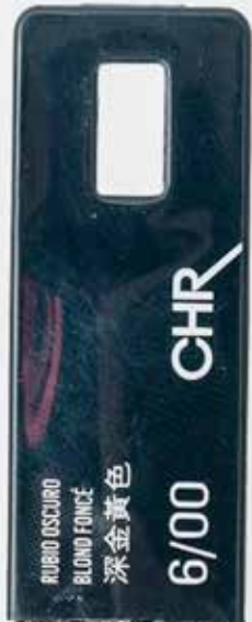
6/00 ТЕМНЫЙ БЛОНДИН